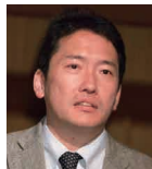
北川 宏 京都大学 副プロボスト 大学院理学研究科 教授