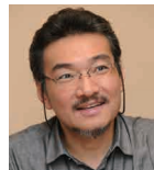
柳沢 正史 筑波大学 国際 統合睡眠医学 研究機構 (WPI-IJIS) 機構長